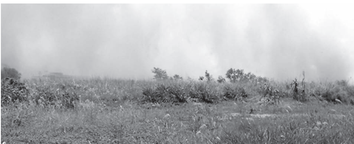
Incêndio demorou cerca de três horas para ser controlado pelos bombeiros