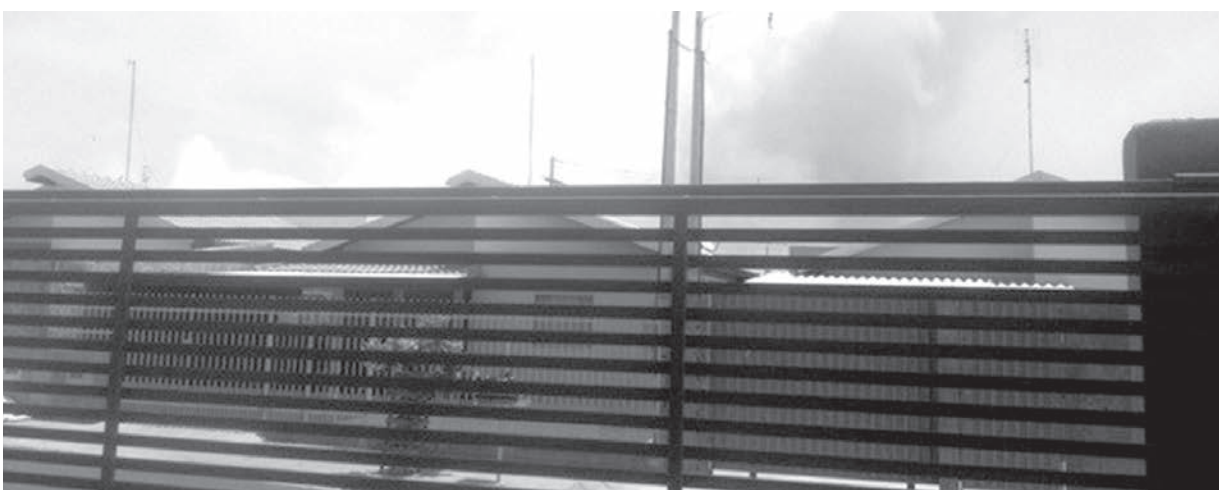
Área urbana próxima ao canavial quase foi atingida pelo fogo

Um incêndio destruiu quatro metros quadrados de um canavial e uma área de pastagem, em Valentim Gentil na última segunda-feira, 19. Segundo informações do Corpo de Bombeiros, a equipe teve ajuda da Defesa Civil e do caminhão pipa de uma usina da região para controlar as chamas. De acordo com os bombeiros, o tempo seco e quente podem ter contribuído para o início do fogo. Foram três horas de trabalho para controlar o fogo. As chamas quase atingiram uma área urbana que fica próxima ao canavial, o que deixou os moradores assustados. Ninguém ficou ferido.