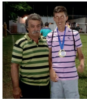
Medalha gol mais bonito