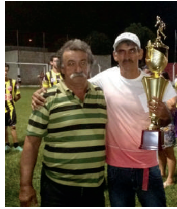
vice campeão - União