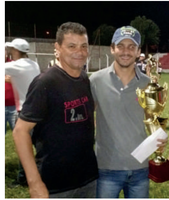
Terceiro lugar - Odiados