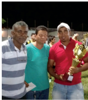
Quarto lugar - Banamel