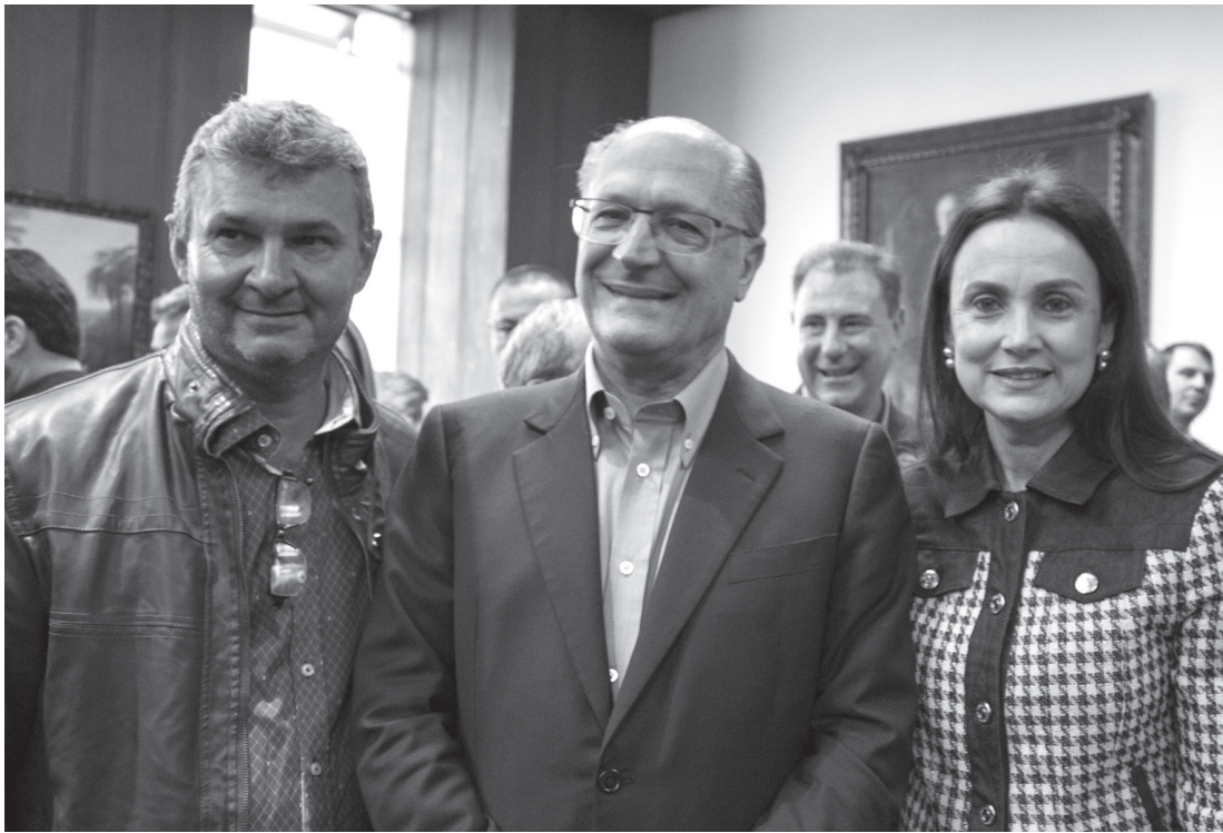
Prefeito Izaías, governador Geraldo Alckmin e deputada Analice Fernandes.

A pavimentação será na estrada que dá acesso ao frigorífico Frigo Sul e irá beneficiar produtores e o frigorífico, que aumentará sua planta produtiva e gerará mais de 100 empregos diretos.