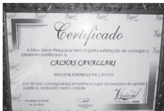
Calhas Cavallari - Melhor empresa de Calhas