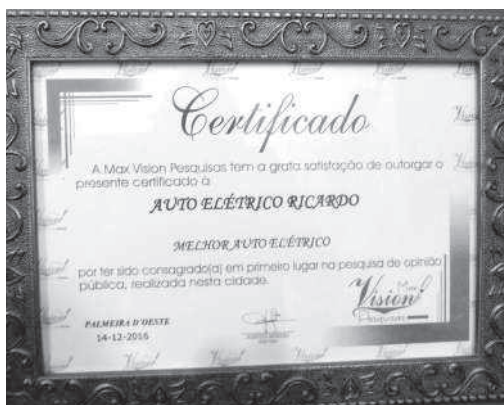
Auto Elétrico Ricardo 15º Ano consecutivo - Melhor Auto Elétrico