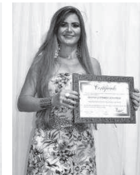
Tatiana Gutierrez Acessórios - Melhor designer de bijuterias e acessórios de moda