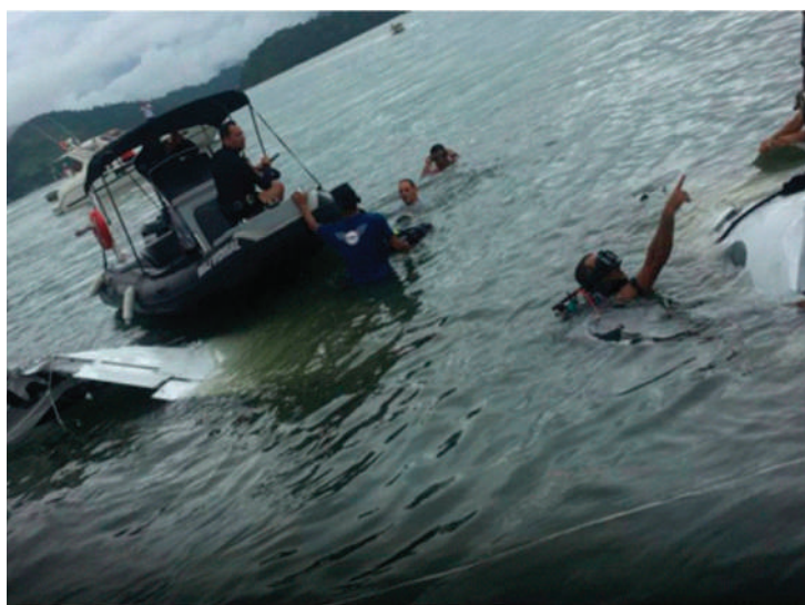
(Mergulhadores durante tentativa de resgate nos destroços do avião, em 19 de janeiro)

Nesta terça-feira 24, os destroços foram recolhidos do mar e levados para o porto de Paraty (RJ). De lá, seguirão para a Base do Aeronáutica, no aeroporto Galeão, no Rio de Janeiro, onde ficarão aos cuidados da Cenipa.