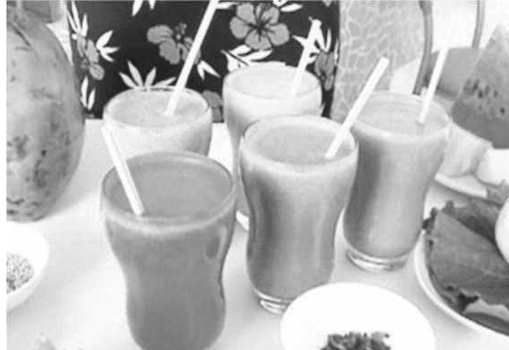
Sucos são opções ideais para hidratação durante o carnaval