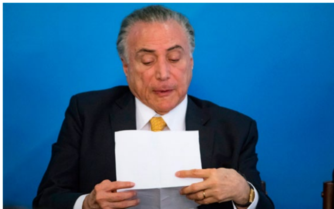
O presidente Michel Temer durante reunião com representantes do setor da indústria e centrais sindicais

Sua aposta mais lucrativa foi a eleição de Eduardo Cunha para a presidência da Câmara, em 2015. Com um investimento de R$ 30 milhões, repassados pela JBS, o grupo