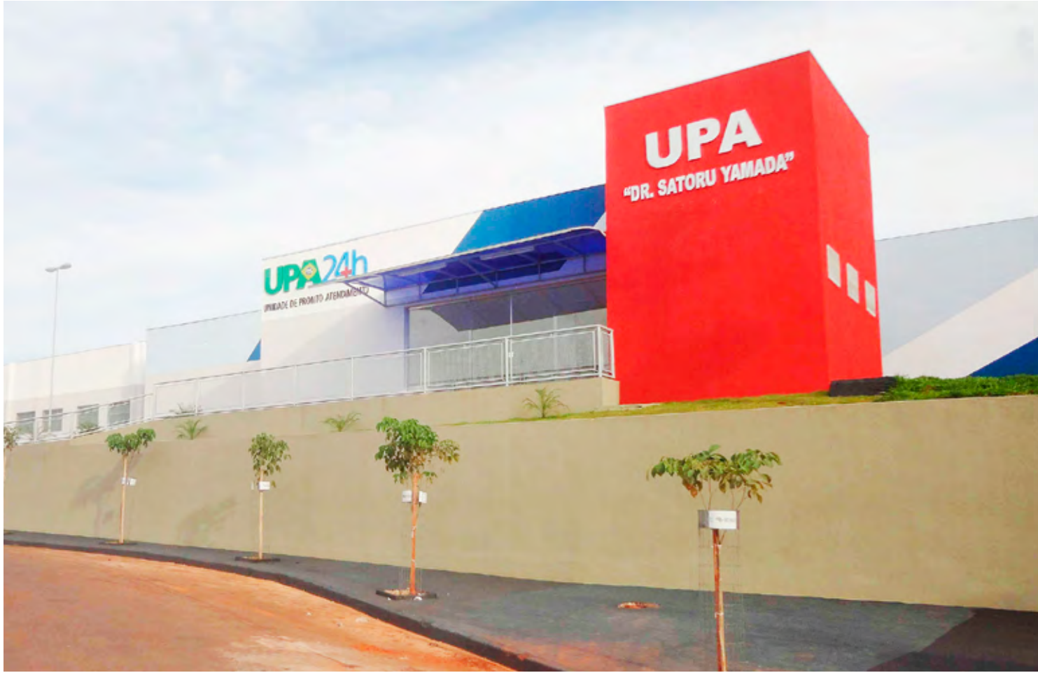
O CONSIRJ, consórcio que administra a UPA, abriu inscrições para Concurso Público para o preenchimento de 22 vagas

Os interessados em concorrer a uma das vagas poderão se inscrever até 13 de setembro de 2018, no endereço eletrônico oficial da banca organizadora Instituto Imagine ( www.institutoimagine.com.br ). Para cargos de nível Fundamental e Médio