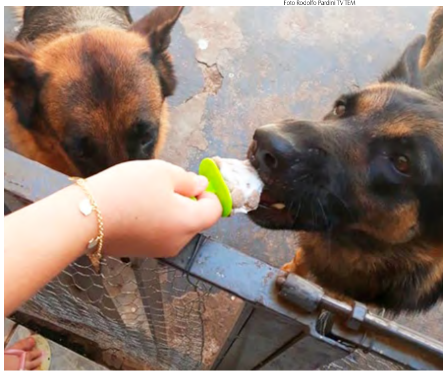
Cadelas comem o picolé feito com leite e ração