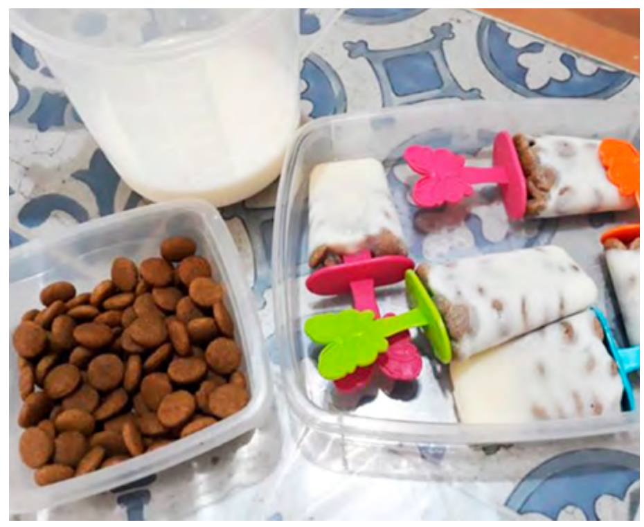
Para fazer o picolé, Giovana usa leite e ração