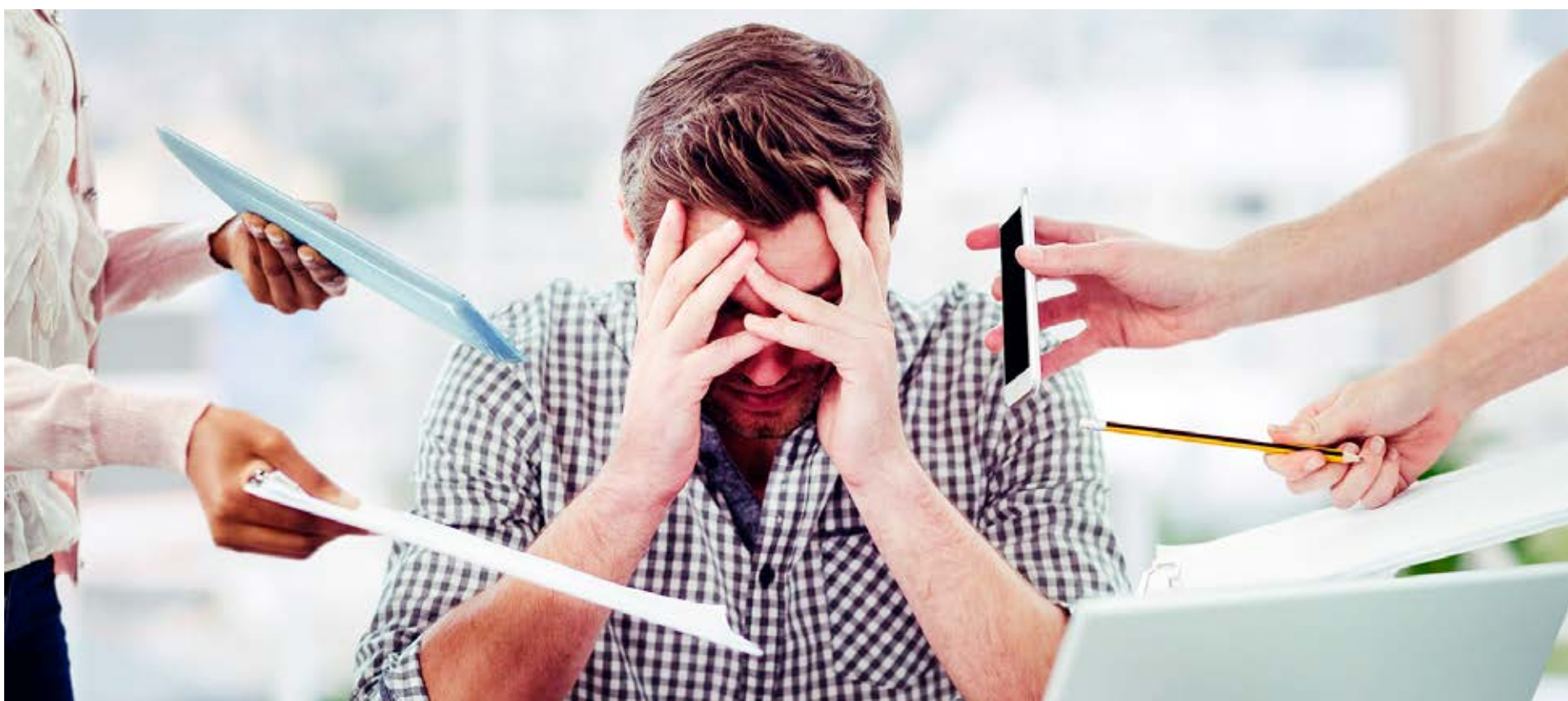
De acordo com o Ministério da Saúde, o estresse é um dos responsáveis por mais de 130 milhões de infartos no Brasil.

1 - Se afaste quando sentir raiva: de acordo com Rita, sentir raiva é normal, mas a frequência dessa emoção pode ser um sintoma negativo. Podemos evitar que ela atinja picos e que nos coloquem em níveis elevados