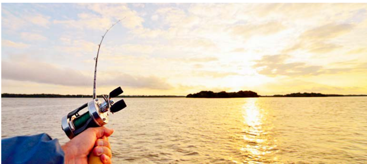
Os rios que banham a região, como o Rio Grande, o Paraná, dentre outros são grandes atrativos para a pesca

Os pescadores, indústrias e comerciantes, além de se atentar a proibição da pesca de espécies nativas, devem informar o volume de seu