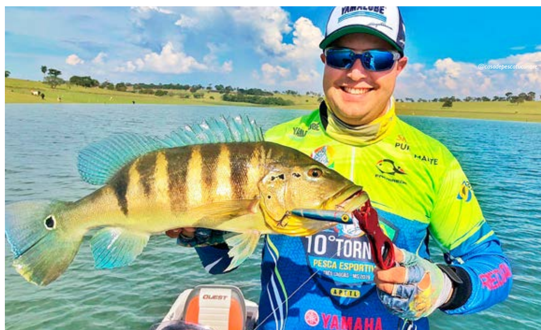
O tucunaré, peixe símbolo dos nossos rios não está entre as espécies proibidas para a pesca durante a piracema

Para a pesca em reservatórios ou pesqueiros há ainda a liberação para pescadores profissionais e amadores realizarem a pesca embarcada ou desembarcada, desde que sigam as determinações para uso de equipamentos de pesca citadas adiante.