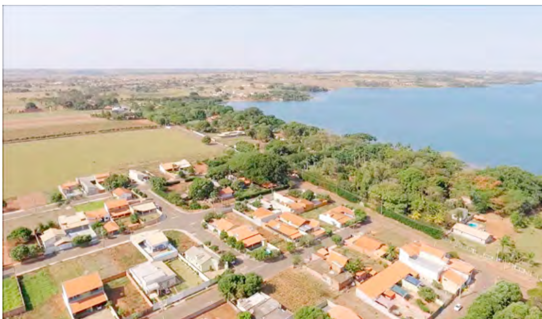
O município de Rubinéia, por sua receita própria de 8,6% é o mais próximo da região a sair da lista de extinção

Destaca-se que a maioria das cidades brasileiras tem baixa população. Os municípios de até 50 mil habitantes correspondem a 87,9%