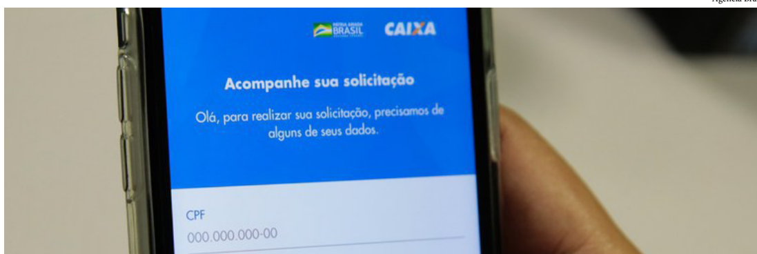
O público incluído nos ciclos de pagamentos restantes engloba quem entrou com a contestação entre 26 de agosto e 16 de outubro, pela plataforma digital

Até o momento, o Governo Federal investiu R$ 262,8 bilhões no pagamento do Auxílio Emergencial, que beneficia diretamente 67,8 milhões de cidadãos e alcança mais da metade da população brasileira.