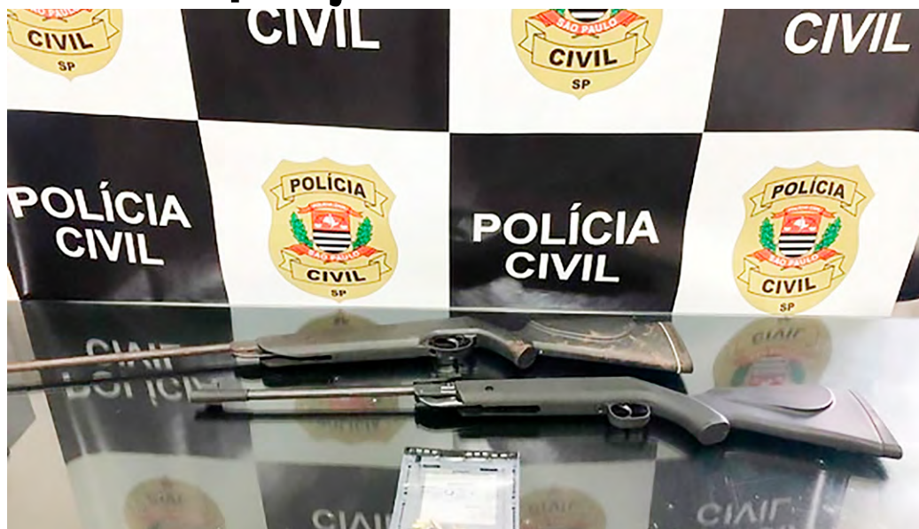
Objetos foram apreendidos na operação da polícia de Jales

Das três pessoas que foram presas, dois foram por tráfico de drogas, já que foram encontradas nas casas deles drogas e dinheiro. O terceiro foi autuado por posse irregular de arma de fogo de uso permitido, porém pagou fiança e foi colocado em liberdade.