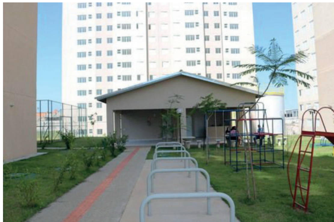
O Conjunto Habitacional Manuel Bueno I será composto por 300 unidades divididas em três blocos com oito unidades por andar

“Estamos realizando a missão do Ministério do Desenvolvimento Regional de levar melhor qualidade de vida aos cidadãos brasileiros e uma promessa do nosso Presidente Jair Bolsonaro de que todas as obras seriam entregues, inclusive aquelas paradas que estão sendo retomadas”, afirma o secre-