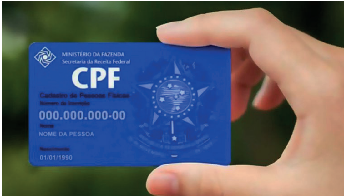
A seção reúne os principais serviços e orientações voltadas à regularização do cadastro

Nas situações mais comuns, não há necessidade de sair de casa. O cidadão pode atualizar o CPF pela internet e, se houver necessidade de apresentar os documentos de identificação, pode enviar por e-mail