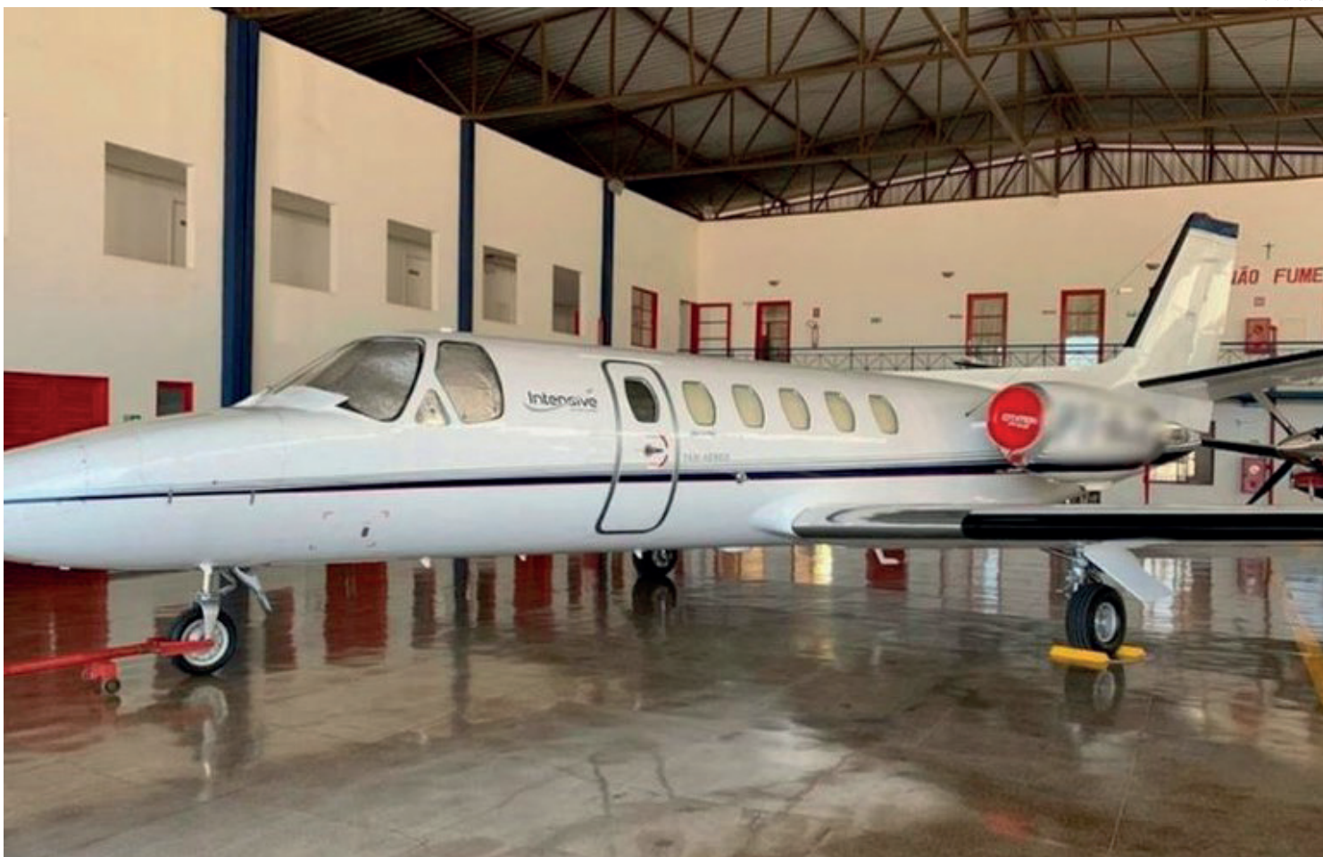
Entre outros itens, estão sendo colocados à venda carros, motocicletas e aeronaves

Segundo o diretor, o Governo Federal vem conseguindo ampliar consideravelmente a quantidade de receitas arrecadadas com atividades criminosas nos últimos meses. “O Ministério da Justiça tinha uma média histórica de R$ 35 milhões