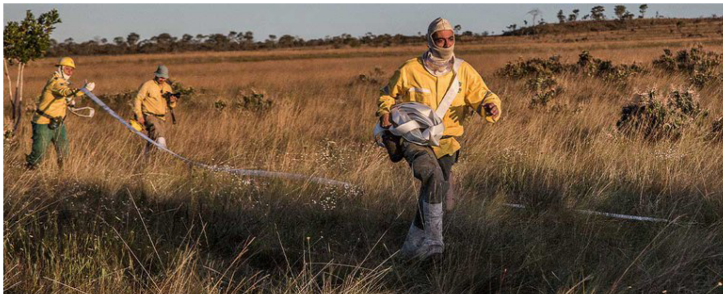
O ICMBio elaborou um cronograma de trabalhos estratégicos a ser executado nos próximos meses

O método faz parte do programa Manejo Integrado do Fogo (MIF) e é usado para queimar todo o combustível orgânico,