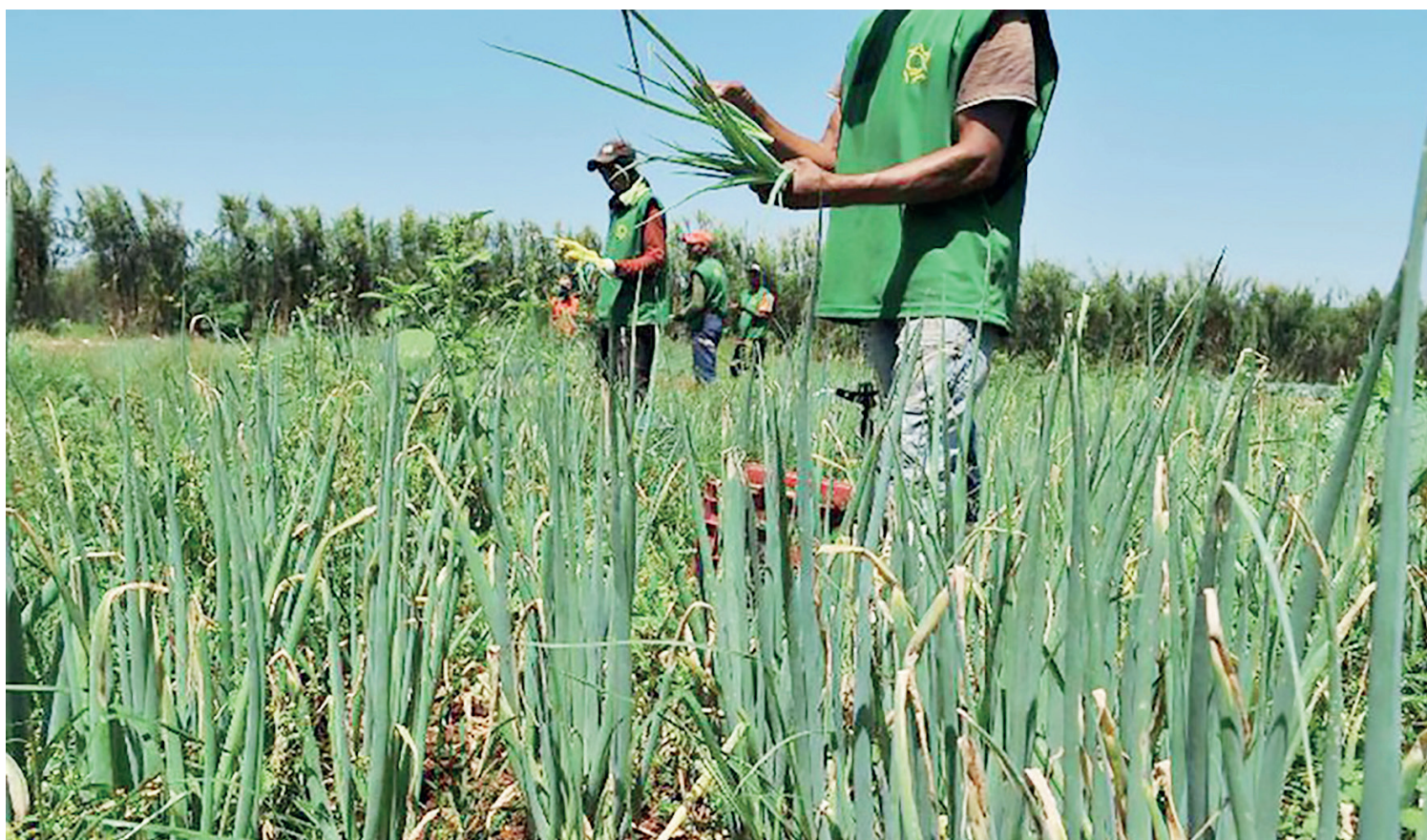
Para 2022, a Subvenção ao Prêmio do Seguro Rural será de R$ 1 bilhão

Para o próximo ciclo, o Plano Safra ficará ainda mais verde, com o fortalecimento do programa ABC, do Inovagro e do Proirriga, abrangendo o financiamen-