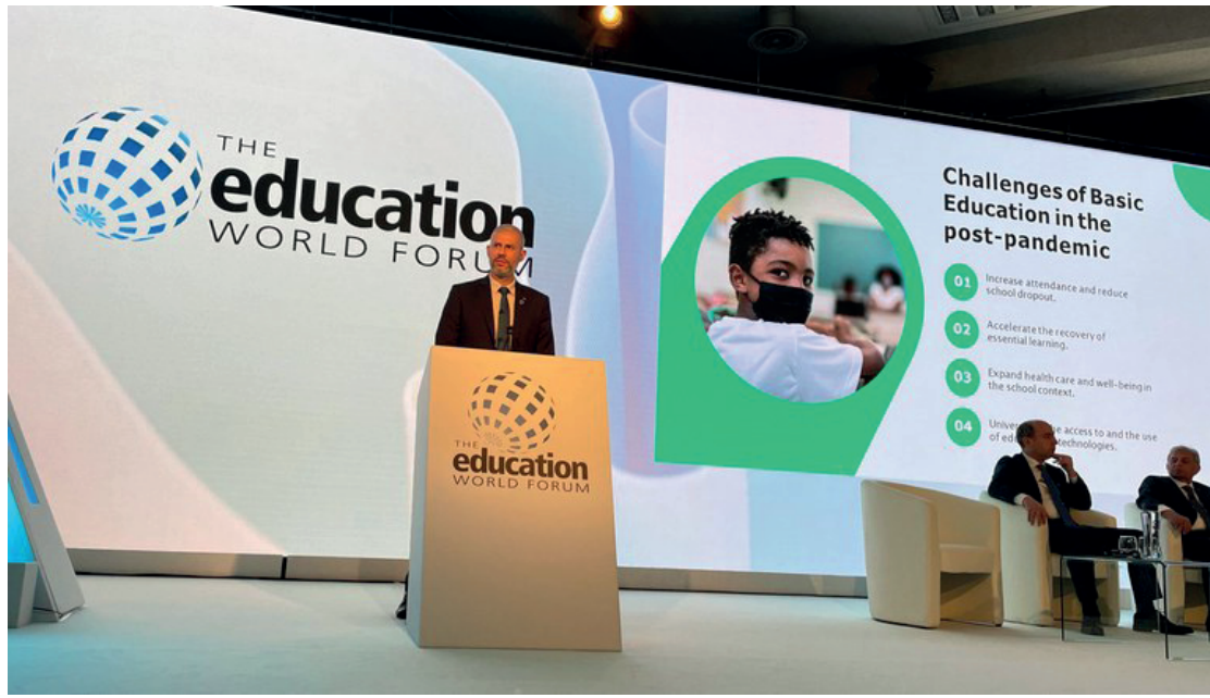
O Governo Federal também transferiu cerca de R$ 718 milhões para a educação básica

A iniciativa foi elaborada a partir de dados e evidências científicas, da identificação de boas práticas no mundo, além da escuta das redes estaduais e municipais de educação. Ela reforça ações de avaliação de diagnóstico e formação das aprendizagens, além do incentivo a estratégias de acompanhamento personalizado dos estudantes. Por isso, de acordo com o Ministério da Educação, tem potencial para auxiliar os professores e as redes no esforço de superação dos desafios