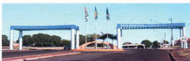
CONSELHO MUNICIPAL DE TURISMO DE PALMEIRA D'OESTE –SP